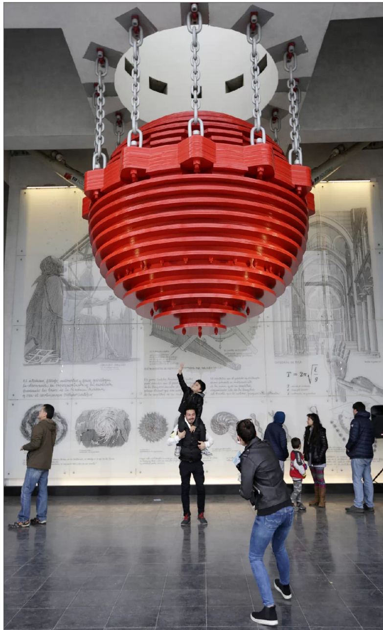
Se encuentra en el piso 22 y este domingo se mostró por primera vez al público general.

“Aunque no se vea, en cualquier sismo y sobre todo en los terremotos de mayor intensidad, todas las estructuras se dañan, las protejas o no. Siempre habrá microfisuras y pe-